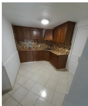
1 impasse de la Roserie (cuisine et salle de bain)

Fort heureusement, certains travaux ont pu être effectués par nos soins (peinture, faïence, divers aménagements et réparations, nettoyage et déblaiement) mais tout ça au détriment de l'entretien des routes et des chemins communaux.